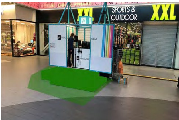
Promo 6. Sepän paja, koko 5 x 3m