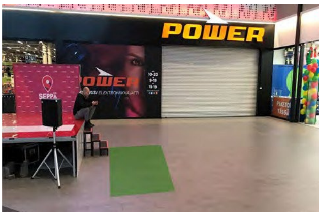
Promo 7. Sepän paja b, koko 5 x 3m